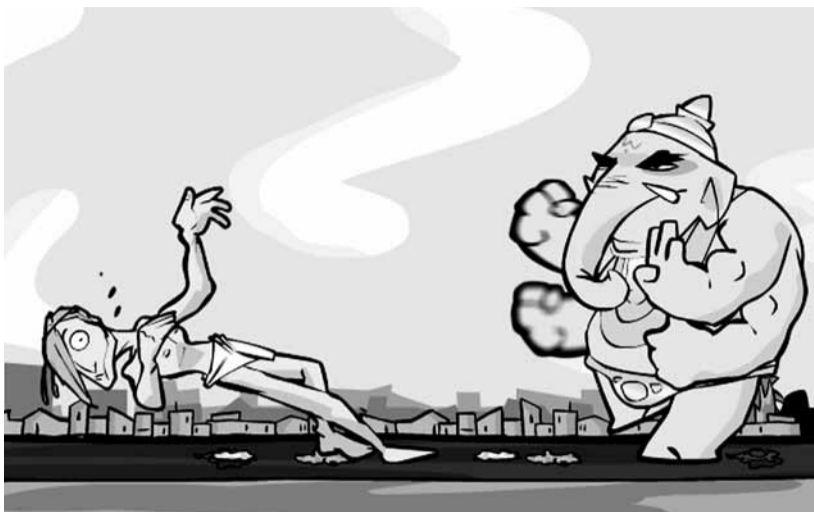
Wer hat den stärkeren imaginären Freund? In der Religionensatire „Faith Fighter“ treten die wichtigsten Gestalten der Weltreligionen gegeneinander an – hier haut Hindugott Ganesha Jesus aus den Latschen.