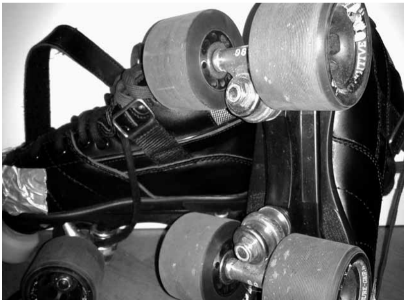
Die Rollen des Anstoßes: Roller Derby erfreut sich wachsender Beliebtheit.

Ein Spiel nennt sich „Bout“ und besteht aus zwei Halbzeiten mit je 30 Minuten. In dieser halben Stunden werden so viele „Jams“ wie möglich gefahren. Jams sind maximal zweiminütige Spielphasen, in denen Punkte gemacht werden können. An der Startlinie des Spielfeldes, dem „Track“, baut sich das „Pack“ auf. Es besteht aus je fünf Spielerinnen pro Team: Die Blockerinnen (je drei pro Team) und Pivots (eine pro Team) stehen vorne, hinter ihnen die beiden Jammerinnen. Letztere sind die Sprinterinnen im Spiel