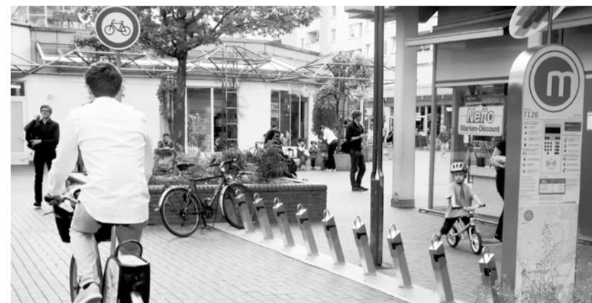
Schildbürgerstreich? Durchfahrtsverbot am metropolradruhr-Ständer im Uni-Center.