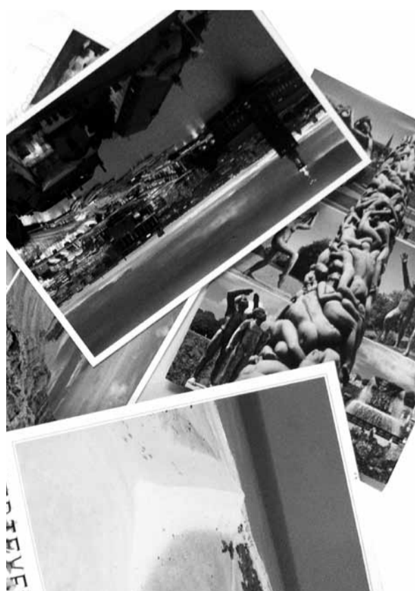
Statt Karten: Lieber mal FreundInnen besuchen.

(clu) Es ist voll auf dem Bahnsteig, denn es ist Freitagnachmittag. Feierabendverkehr trifft auf Wochenendpendelei und einige Verreisende. Am Gepäck der Menschen lässt sich ablesen, ob diese eher auf der Durchreise, auf dem Heimweg oder auf wirklich großer Fahrt sind. Und dann sind da noch Abholende. Sie haben kaum Gepäck und stehen auch nicht so nah am Gleis. Ich bin heute ebenfalls eine von denen, die mit dem eigentlichen Bahnhofsgeschehen wenig zu tun haben. Ich warte auf meine beste Freundin Lili, die ich schon