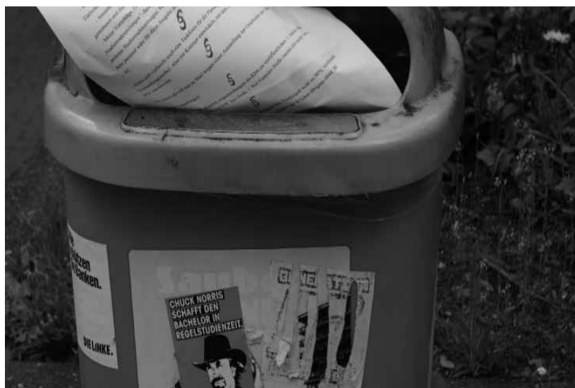
HZG: Wird das Gesetz oder kann das weg?

Zudem stößt die mit dem HZG-Entwurf verbundene geplante Änderung der Haushalts- und Wirtschaftsführungs-Verordnung der Studierendenschaften NRW (HWVO) vorgesehene verpflichtende Anstellung von „Fachpersonal für den Haushalt“ weiterhin auf strikte Ablehnung des RUB-AStAs: „Bei dieser Position handelt es sich um eine der unsinnigsten Änderungen gegenüber dem aktuell geltenden Hochschulfreiheitsgesetz“, echauffiert sich Kathrin Jewanski. In diesem Punkt hat die landespolitische Führung dem Druck der KritikerInnen bereits etwas nachgegeben: „Diese Person soll nach dem Regierungsentwurf die Finanzreferentin bei ihren