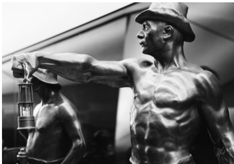
Bergbau: Hier hat sich der Mensch die Unterwelt zu eigen gemacht – nicht ohne Risiko.

Gut, die Unterwelt ist es noch nicht – sondern der Übergang dazu. Rund 300 Exponate warten insgesamt. Die ersten zeigen, wie Menschen verschiedener Epochen den Weg in die Hölle gedacht haben. In diese Kategorie fällt auch der Feuer-Leviathan, das Titelmotiv der Ausstellung. Ein geöffneter Rachen, durch den BetrachterInnen ins Innere der Hölle blicken. Als Vorlage diente eine Radierung von 1745. Holzstiche von Gustave Doré und Albrecht Dürer aber auch viele Werke anderer Künstler sind von Dantes Göttlicher Komödie inspiriert. Und weil zahlreiche gelehrte Anspielungen das Verständnis der berühmten Vers-Erzählung erschweren, hat der ameri-