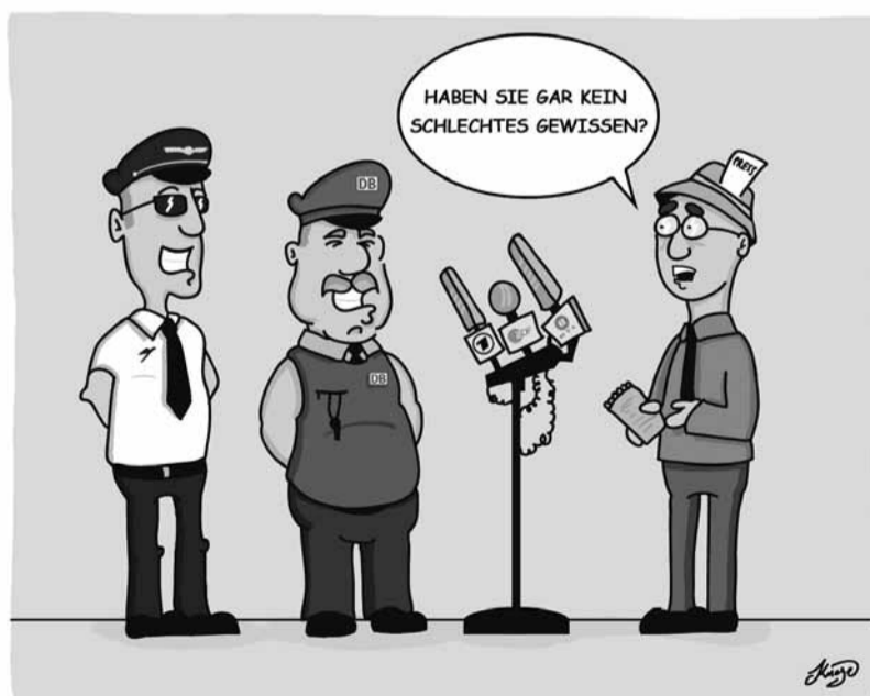
Neulich auf der Pressekonferenz: Wen interessiert schon der Streik?