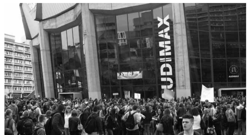
Belagerungszustand: AbiturientInnen-Massen vorm größten Hörsaal.

Die Rede von Prof. Dr. Wilkens wurde von einer unvermeidlichen Power-Point-Präsentation begleitet. Bei den erfreulichen Nachrichten, welchen Status die RUB hat, befanden sich zwei Fotos: Auf dem größeren war der jetzige Zustand der Universität zu sehen und auf einem deutlich kleineren ein Entwurf, wie die RUB 2025 aussehen soll. Auf die Fotos wurde gar nicht weiter einge-